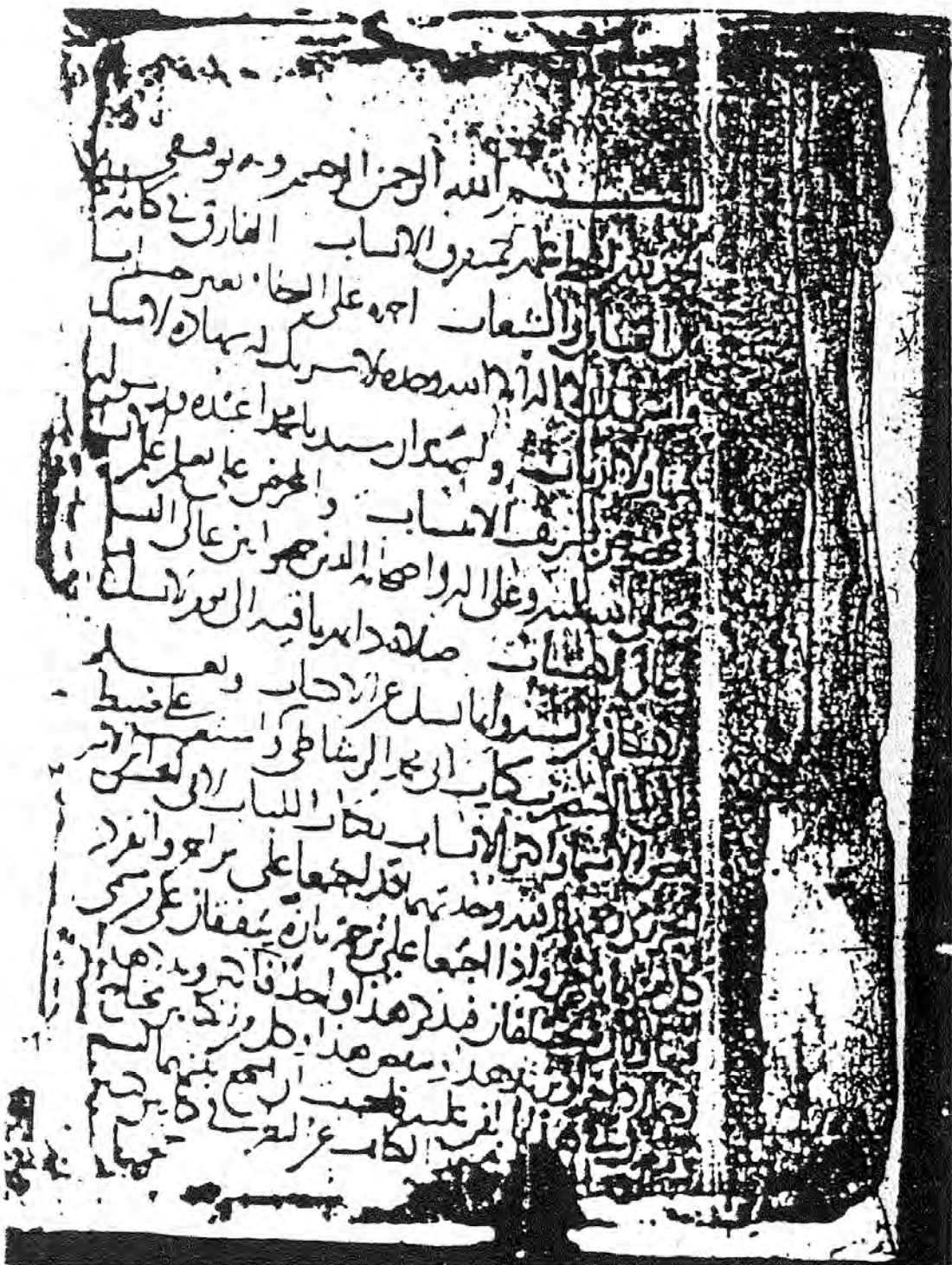
( الصورة ٣ )